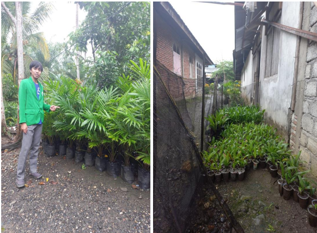
Foto budidaya bibit kelapa sawit di halaman belakang rumah Ketua Kelompok Tani Semangat Empat Bapak Ainal Yakin, 07 Mei 2022