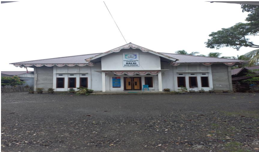
Foto tampak depan Balai Desa Pebatae, 05 Mei 2022