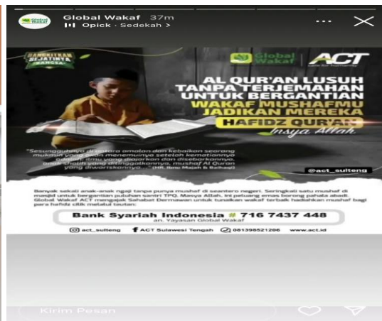
Distribusi Wakaf Al-Qur'an Oleh Aksi Cepat Tanggap (ACT) Palu